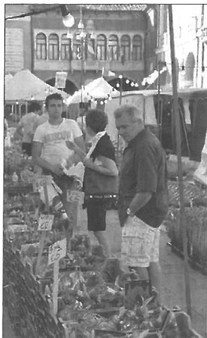
BANCARELLE Sono 130 in tutto, aperte fino alle 23

Sulle pagine de IL GAZZETTINO di Rovigo è possibile pubblicare i Necrologi