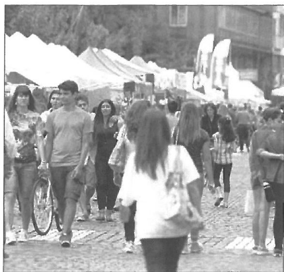
AFFOLLATO Corso del Popolo con le bancarelle di EuroRovigo 2014

COLORI & SAPORI Spezie orientali e cioccolato