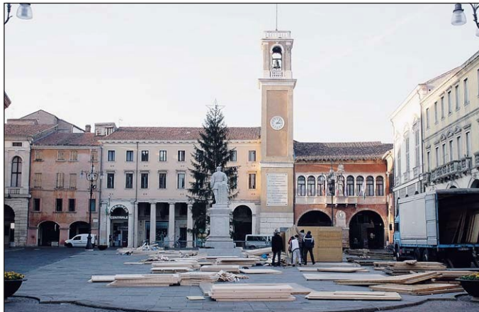
I mercatini di Natale ieri in fase di allestimento

Da domani a domenica, inoltre, Corso del Popolo ospiterà dalle 10 alle 22 le bancherelle di "Art&Cioc", il tour nazio-